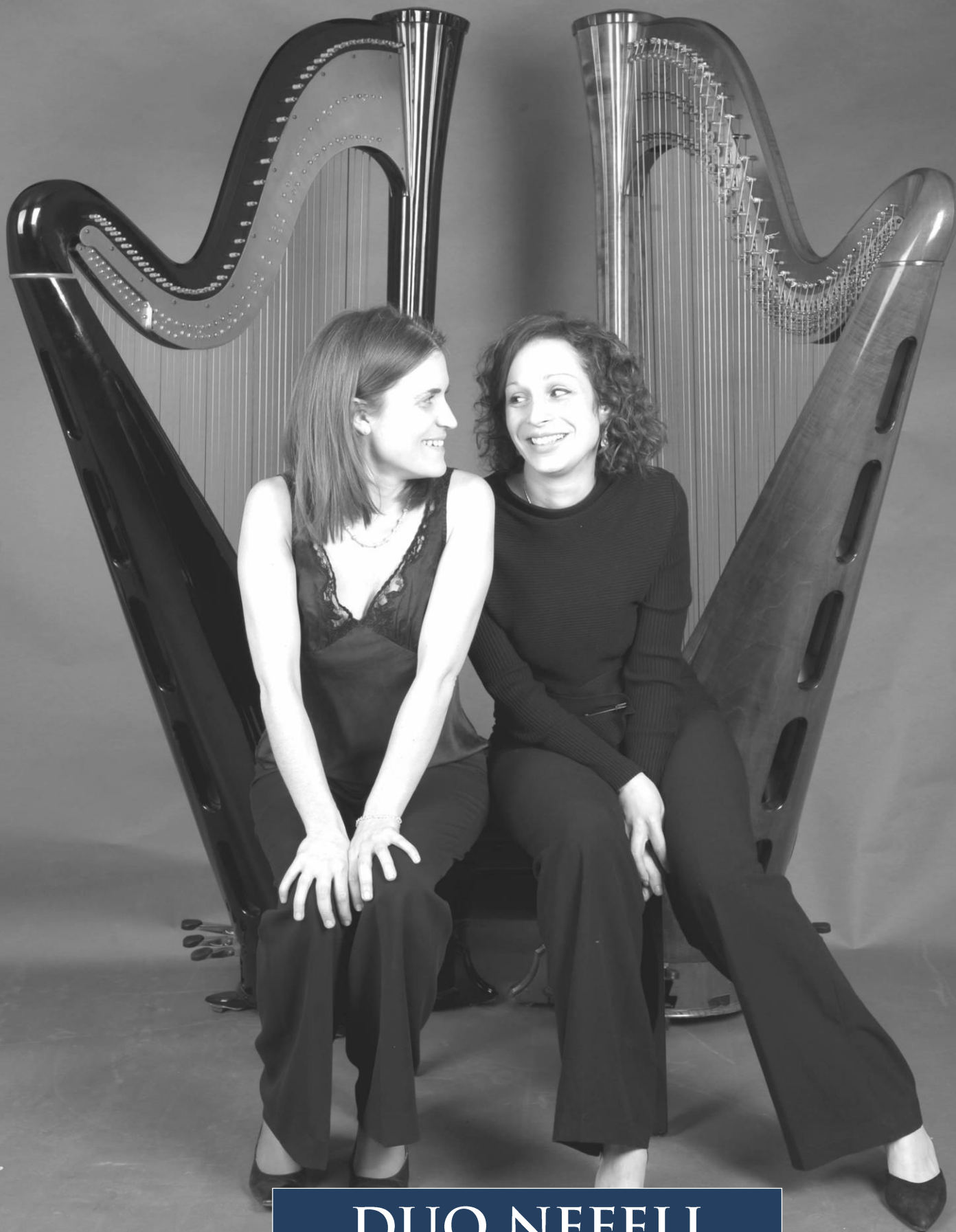
DUO NEFELI QUATRE MAINS ET 94 CORDES DE VIRTUOSITÉ